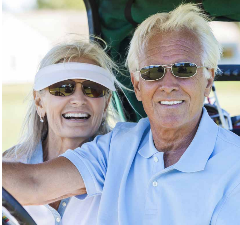
Die perfekte Golfbrille, z. B. mit integriertem Polarisationsfilter, bietet Sehkombi und modische Ausstrahlung in einem.

Sorgfältig evaluierte Brillengläser erhöhen zudem den Komfort und erfüllen eine wichtige Schutzfunktion. Besseres Kontrastsehen dank selektiver Transmission, das Verhindern von Blendung, der Schutz vor Sand, Wind und Pollen sind die wichtigsten Anforderungen an golfoptische Qualitätsgläser.